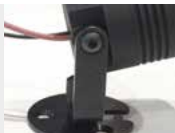
Rotation sur 180° 180° rotation