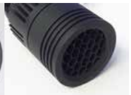
OPTION Grille nid d'abeille Honeycomb