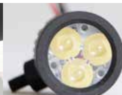
Lentille elliptique Elliptic lens